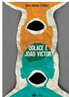
Uólace e João Victor Autor: Rosa Amanda Strausz Editora: FTD