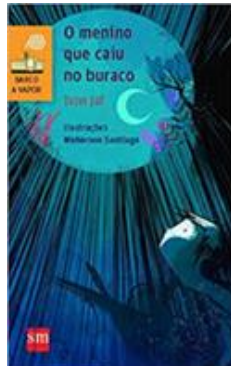
O Menino que Caiu no Buraco Autor: Ivan Jaf Editor: SM