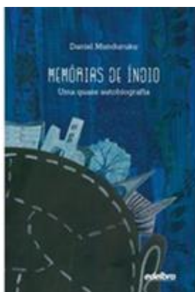
Memórias de índio: uma quase autobiografia Autor: Daniel Munduruku Editora: Edelbra