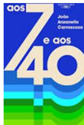
Aos 7 e aos 40 Autor: João Anzanello Carrascoza Editora: Alfaguara