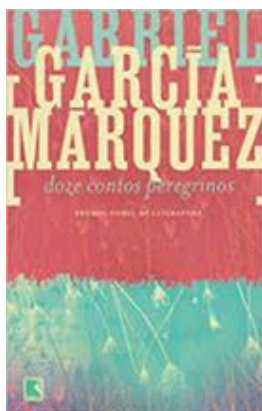
Doze contos peregrinos Autor: Gabriel García Márquez Editora: Record