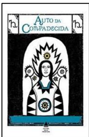
Auto da Compadecida Autor: Ariano Suassuna Editora: Nova Fronteira