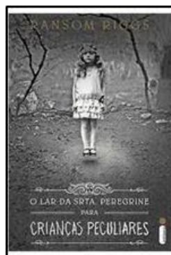
O Lar da Srta. Peregrine para Crianças Peculiares Autor: Ransom Riggs Editora: Intrínseca