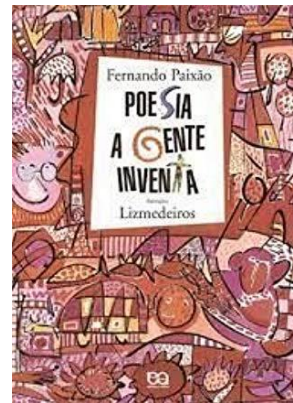
Poesia a Gente Inventa Autor: Fernando Paixão Editora: FTD