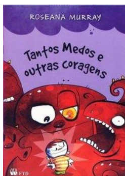
2. Tantos medos e outras coragens – Roseana Murray – Editora FTD