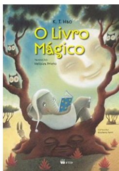
1. O livro mágico – K. T. Hao – Editora FTD