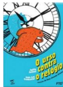
4. O urso contra o relógio – Joëlle Jolivet e Jean-Luc Fromental – Editora FTD