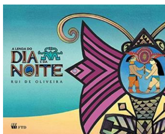
2. A lenda do dia e da noite – Rui de Oliveira – Editora FTD