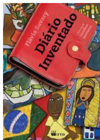
Diário inventado. Flávia Savary. Editora FTD.