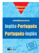
Minidicionário Bílingue Inglês Silveira Bueno