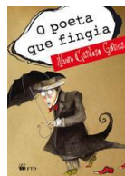
O POETA QUE FINGIA Autores: Alexandre Camanho (Ilustrador), Álvaro Cardoso Gomes (Autor)

OBSERVAÇÃO: os estudantes deverão adquirir as obras acima relacionadas, considerando que serão trabalhadas durante o ano letivo, no componente curricular de Língua Portuguesa. A biblioteca dispõe somente de 2 exemplares, conforme normas do Conselho Estadual de Educação.