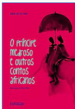
O príncipe medroso e outros contos africanos Autores: Anna Soler-Pont Editora: Seguinte