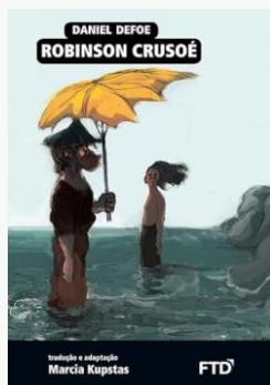
Robinson Crusóé Autor: Daniel Dafoe Editora: FTD