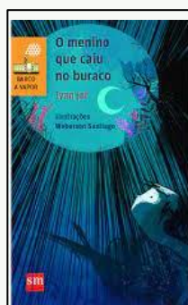
O menino que caiu no buraco Autor: Ivan Jaf Editora: SM