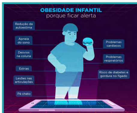
Objetos de Aprendizagem